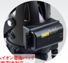
専用リチウムイオン電池パック 単3アルカリ乾電池対応 電池収納ボックス