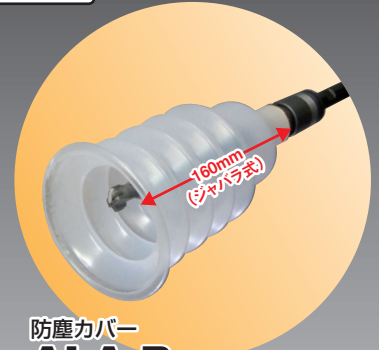
防塵カバー ALA-B 標準価格: 1,600円 (税込1,760円) JAN: 4528235 223187