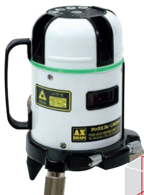
屋内・屋外兼用レーザー墨出し器