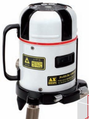
屋内・屋外兼用レーザー墨出し器